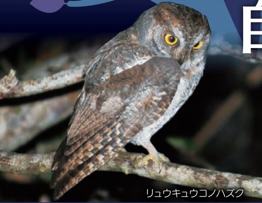
リュウキュウコノハズク