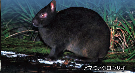
アマミノクロウサギ